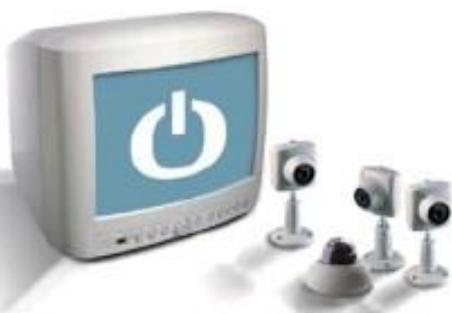
Televisioni a circuito chiuso (TVCC)