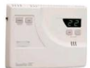
Sistemi di risparmio energetico